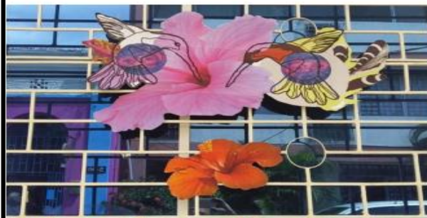
Obra de Isabel Boncallo Uribe, de Santa Marta, para el programa Intercambio artísticos en época de pandemia.