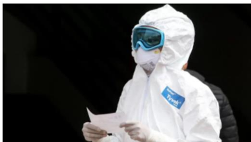
Foto: Personal de salud atendiendo COVID-19 en el Hospital Ajusco Modulo Cuernavaca